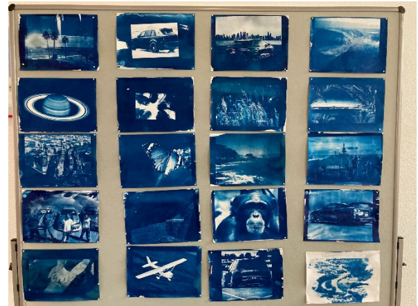
Bild: einige Resultate des Kurses Cyanotypie

Wegen der Vorgaben des Volksschulamtes konnte unsere geplante Kurswoche coronabedingt nicht stattfinden. Deshalb haben die Lehrpersonen kurzfristig unter grossem Aufwand eine klasseninterne Spezialwoche auf die Beine gestellt. Die Jugendlichen erlebten eine interessante und abwechslungsreiche Woche mit verschiedensten Themen, entweder in Oberrieden oder bei spannenden Exkursionen.